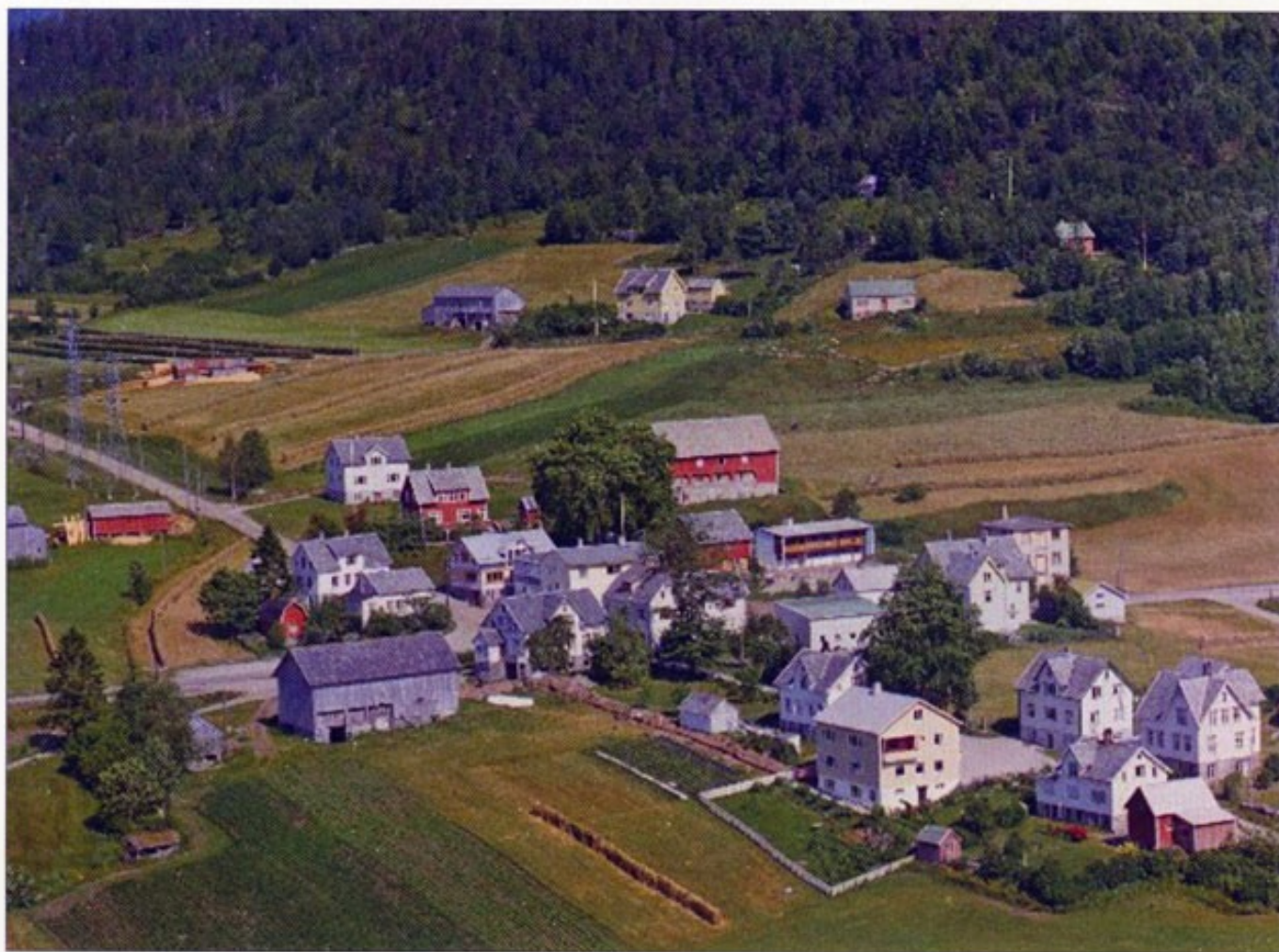
Korsvegen 1962.